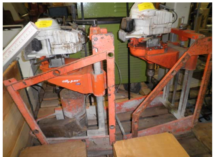
Pos. 0003 + 0004

Irrtümer und Aussonderung von Fremdrechten vorbehalten!