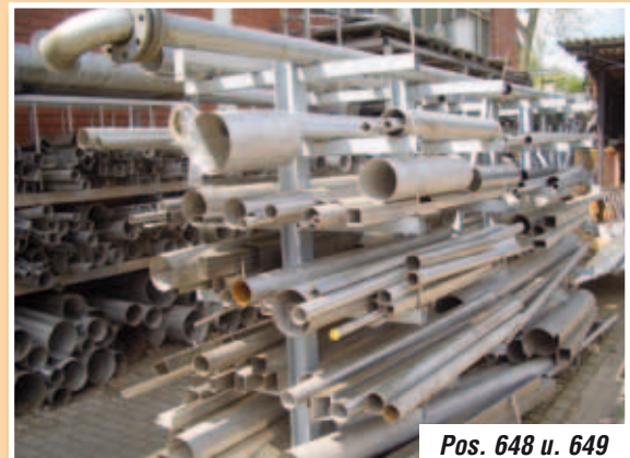
Pos. 648 u. 649