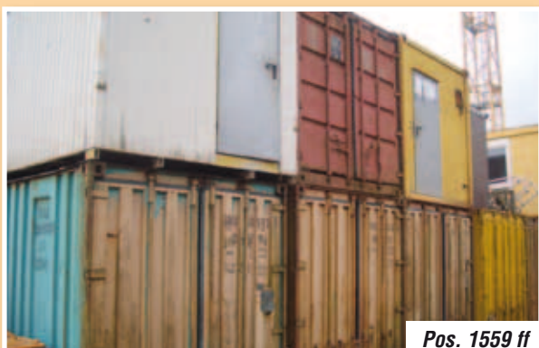
Pos. 1559 ff