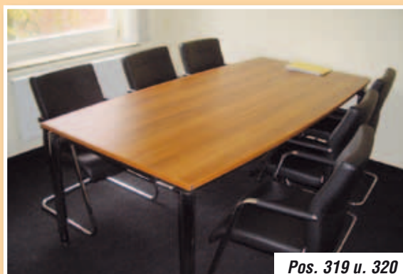
Pos. 319 u. 320