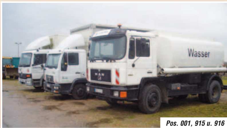
Pos. 001, 915 u. 916