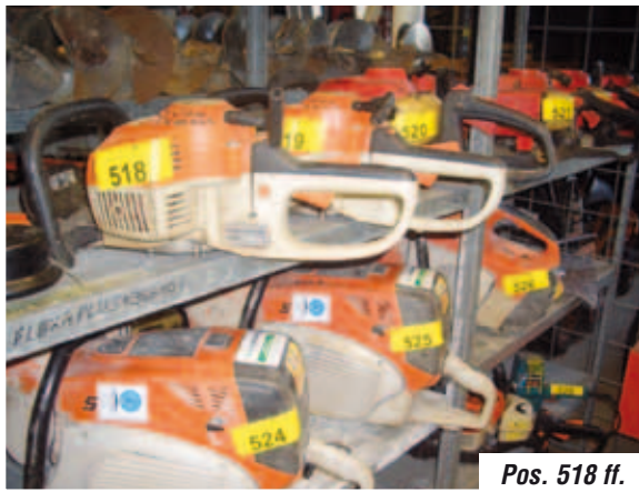
Pos. 518 ff.