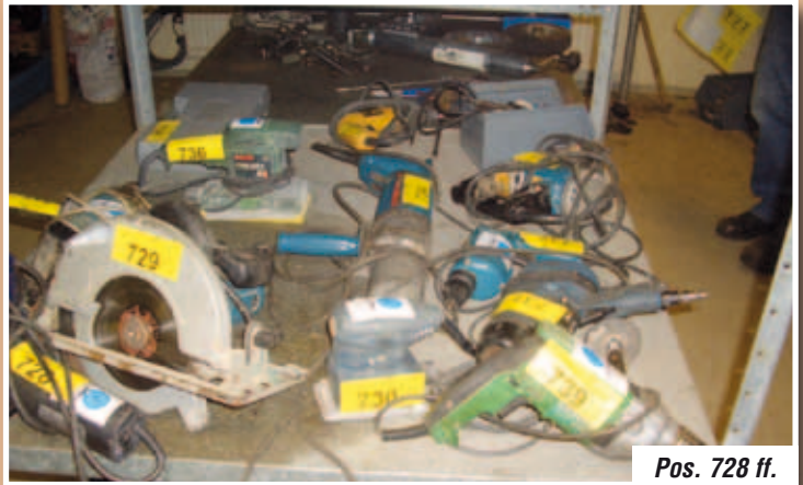
Pos. 728 ff.