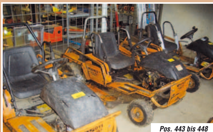
Pos. 443 bis 448