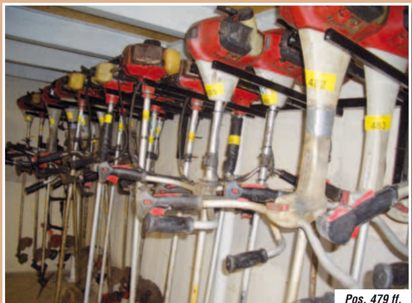
Pos. 479 ff.