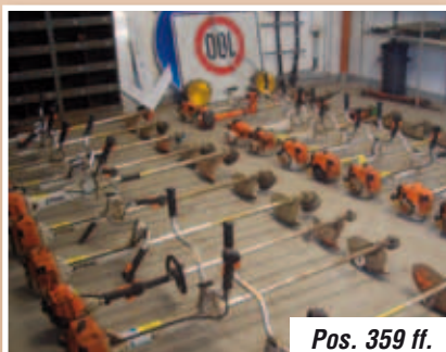
Pos. 359 ff.