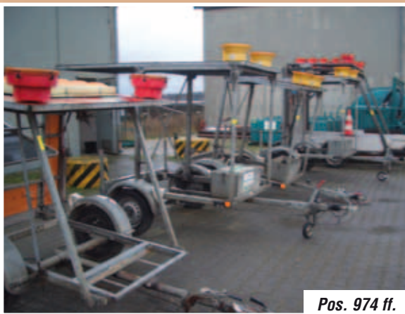
Pos. 974 ff.