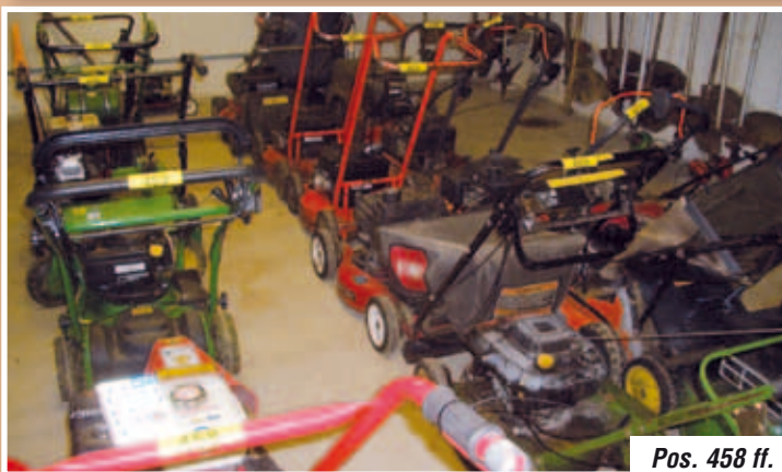
Pos. 458 ff.