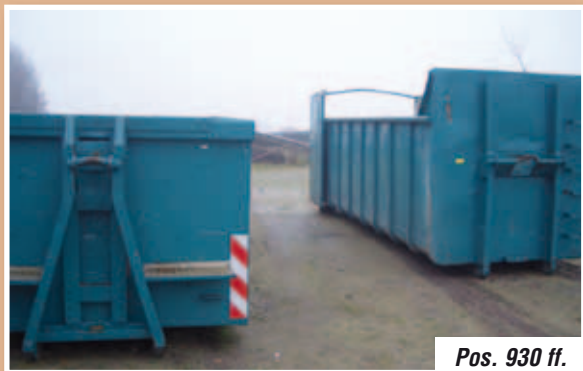
Pos. 930 ff.